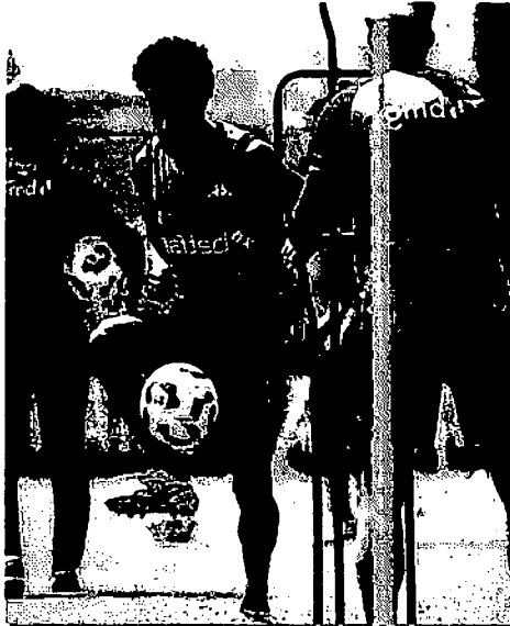
▷ TCHÊ TCHÊ DEVE SER TITULAR CONTRA O PALMEIRAS. HOJE, NO ALLIANZ PARQUE

Com as ausências de Barros e Carlos Cuesta, Diniz tenta nova formação contra o Palmeiras. Tchê Tchê pode ser uma das alternativas vascaínas