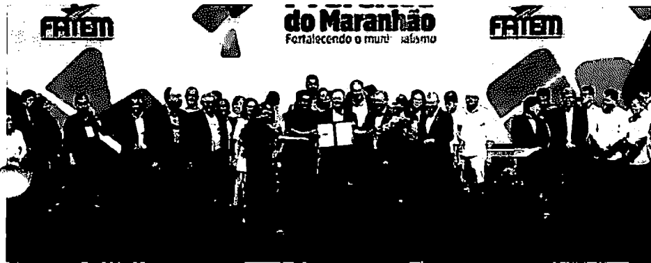
ENCONTRO DE PREFEITOS DO MARANHÃO REUNIU CERCA DE 5 MIL PESSOAS

O anúncio foi feito durante a solenidade de abertura do Encontro de Prefeitos. O investimento deve atingir quase todos os municípios do Estado