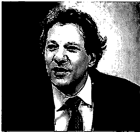
FERNANDO HADDAD PROJETA PIB ACIMA DE 3%

Na última semana, o ministro da Fazenda, Fernando